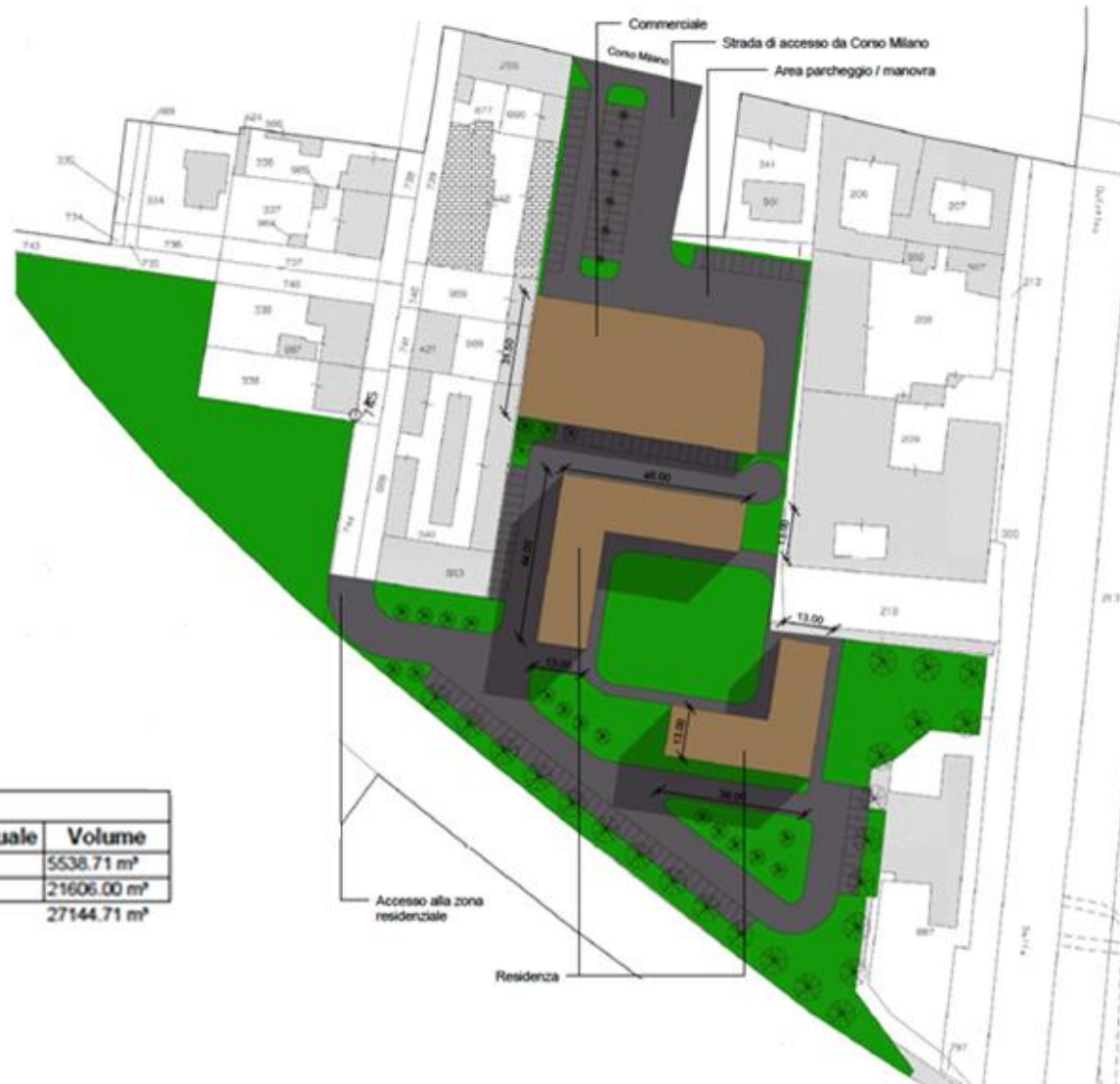
Calcolo superfici e volumi - Progetto

Nel rispetto dei limiti massimi previsti dal PRG vigente la piastra commerciale può essere ampliata.